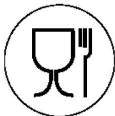
Рисунок 1 для пищевой продукции