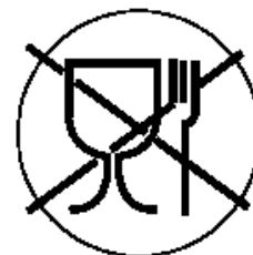
Рисунок 3 для непищевой продукции